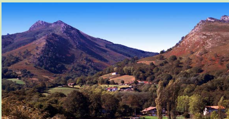
Vers la Rhune.

Cette traversée des collines du Labourd offre de belles vues sur les montagnes et la côte basque. De la thermale Cambo à la frontière Sare, de sous-bois en lignes de crêtes, le GR 8® vous surprendra.