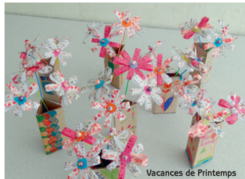
Vacances de Printemps

La programmation des activités sera communiquée aux familles en temps et en heures