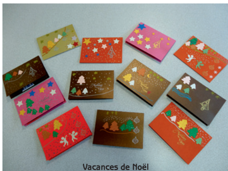
Vacances de Noël