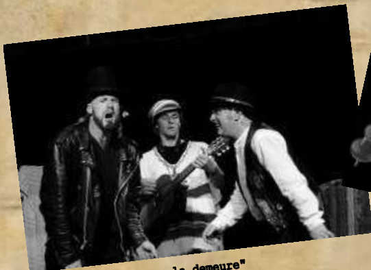
"Périple en la demeure" LUNA NEGRA - BAYONNE