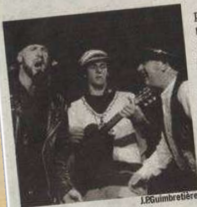
Les Crieurs pudiques. J.P. Guimbretière

Salle bondée, énorme succès à la Luna Negra jeudi soir et grande écoute de la part d'un public chaleureux et conquis à deux reprises au travers des performances du groupe musico-théâtral des Crieurs pudiques.