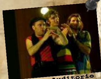
Auditorio ST JEAN DE LUZ