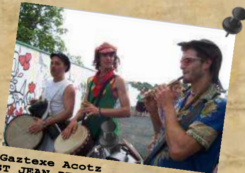
Gaztexe Acotz ST JEAN DE LUZ