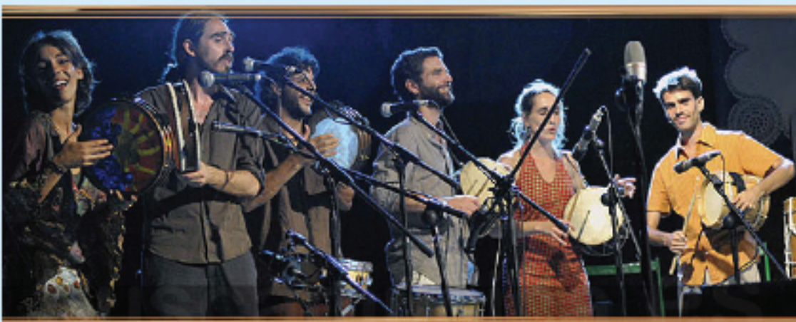
Une partie de l'ensemble COETUS