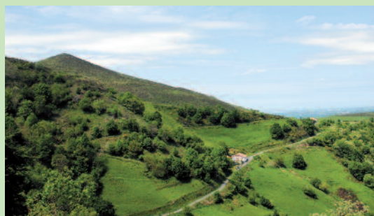
Sentier et sommet du col d'Atharri

Itinéraire intéressant pour la découverte de belles vues sur la vallée de la Nive, et des gorges du Pas de Roland.