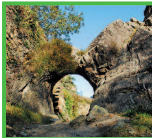
Le Pas de Roland

Le long d'un sentier muletier longeant les gorges d'Ateka et la Nive, un étroit passage taillé dans la roche relie la vallée à la ligne frontière. Des légendes qui lui sont attachées, ce passage a gardé le nom de « Pas de Roland ». Pour certains, Roland, neveu de Charlemagne, se rendant à Roncevaux combattre les Sarrasins (en réalité les Basques), se heurta à un rocher infranchissable. Son épée « Durandal » qui ne le quittait jamais, permit à Roland de tailler un passage pour ses soldats qui purent ainsi poursuivre leur chemin. Pour d'autres, cette brèche dans la roche serait le résultat d'une ruade du cheval de Roland. Quelle que soit la légende, le superbe paysage vaut le détour.