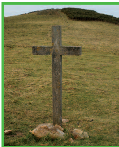
La croix du sommet d'Atharri

⑥ 0629314-4798225, avant de retrouver le village.