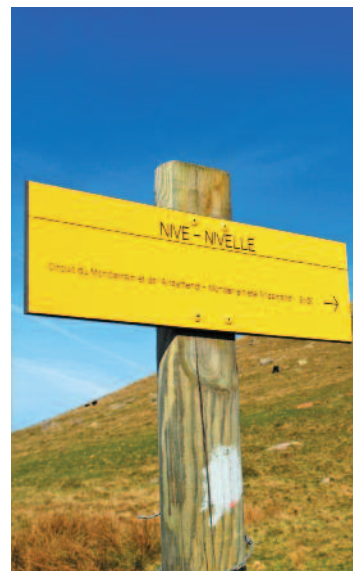
Une photo locale des sentiers ou balisage

Durée de la randonnée : La durée de chaque circuit est donnée à titre indicatif. Elle tient compte de la longueur de la randonnée, des dénivelées et des éventuelles difficultés.